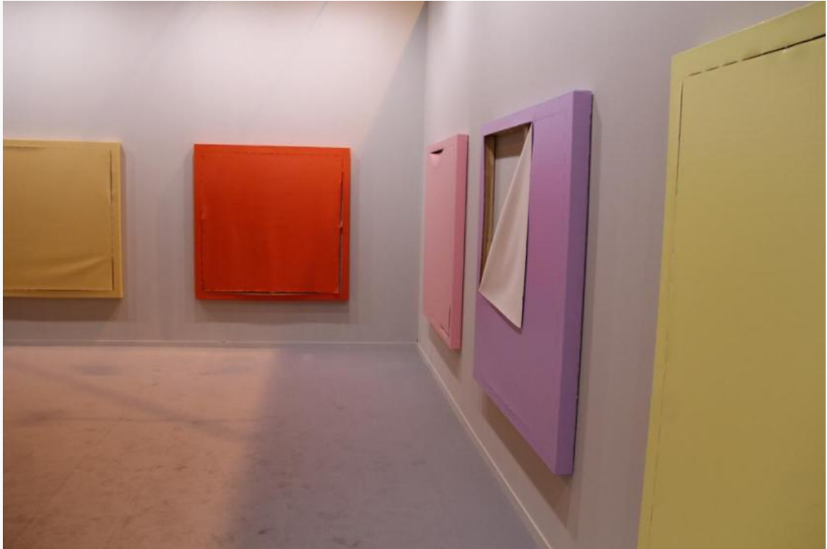
Obras de Ángela de la Cruz, artista invitada de Estamapa 2018