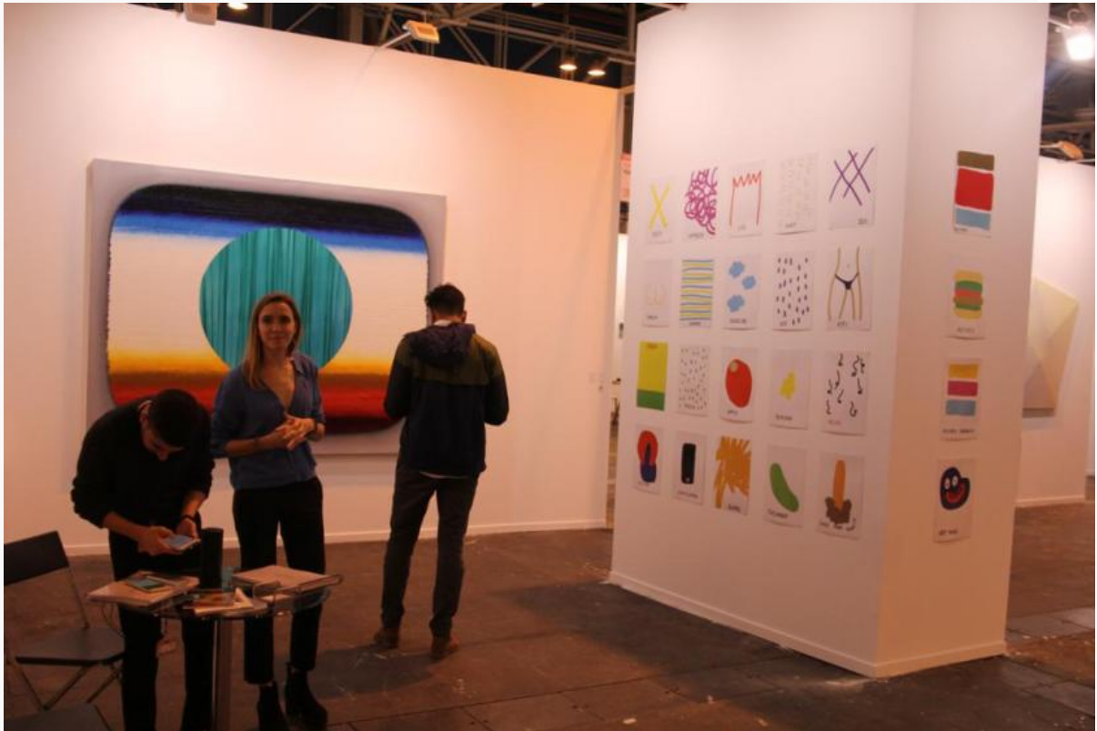
Estand de Ponce-Robles en “Contraindicaciones”

pública y asemejándose a otra feria donde el dinero de todos en demasiadas ocasiones ha tenido la última palabra.